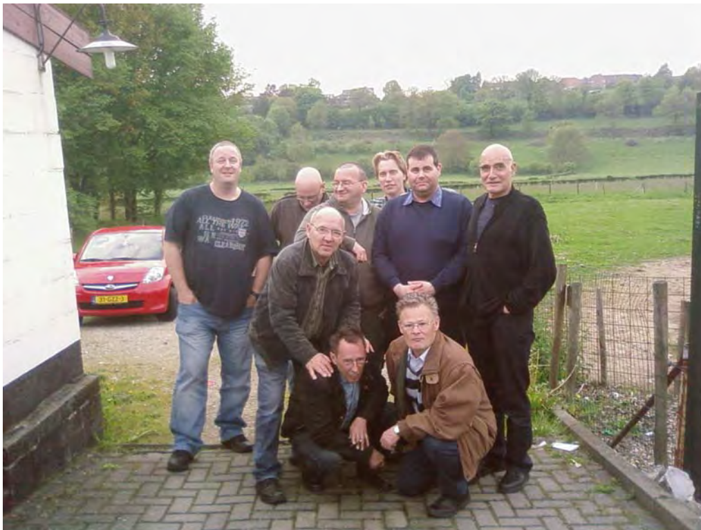
Op de foto de Schaesbergse delegatie die dit jaar meedeed aan de kroegentocht in Noorbeek.